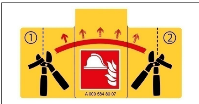
Rótulo indicativo del preequipo alternativo de desconexión de alto voltaje

Debajo de la cubierta de la caja de fusibles, izquierda, en el cockpit se encuentra el dispositivo alternativo de desconexión de alto voltaje. Está señalizado con un rótulo indicativo.