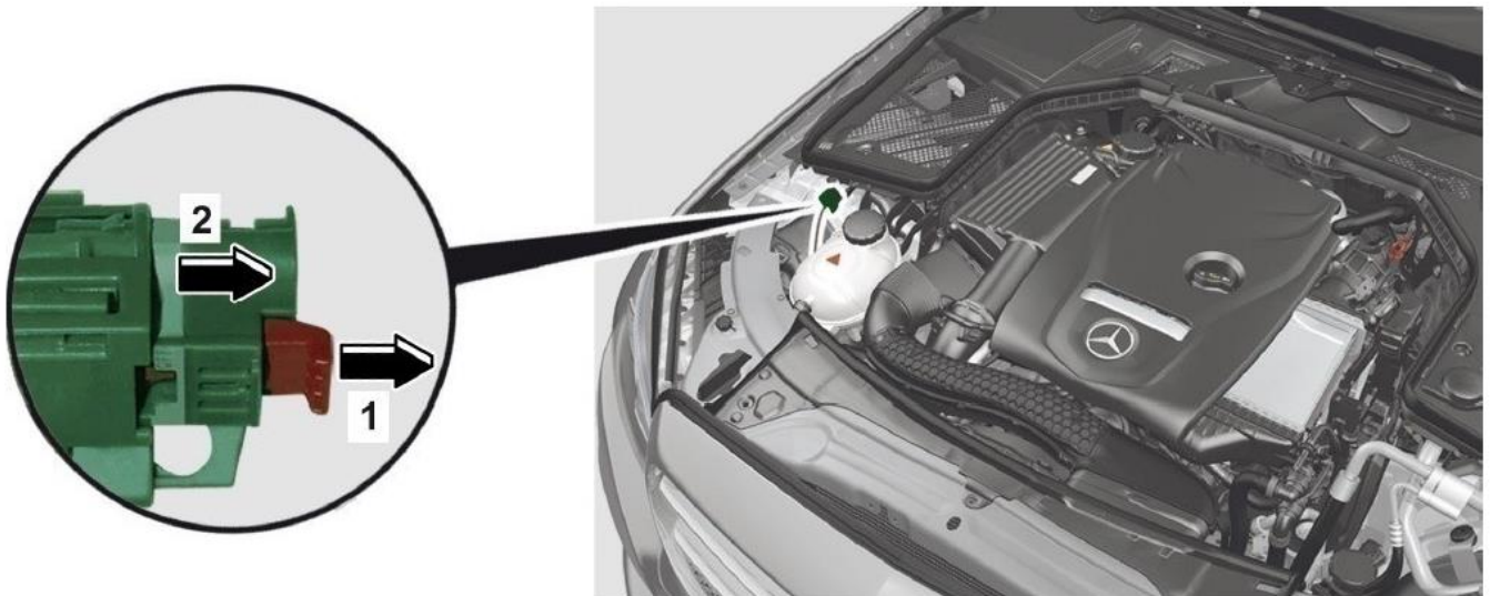
Dispositivo de desconexión de alto voltaje en el vano motor, Accionar el desbloqueo (1) / extraer el interruptor (2)

El dispositivo de desconexión de alto voltaje se encuentra en el vano motor, a la derecha en el sentido de marcha junto al depósito de expansión del líquido refrigerante.