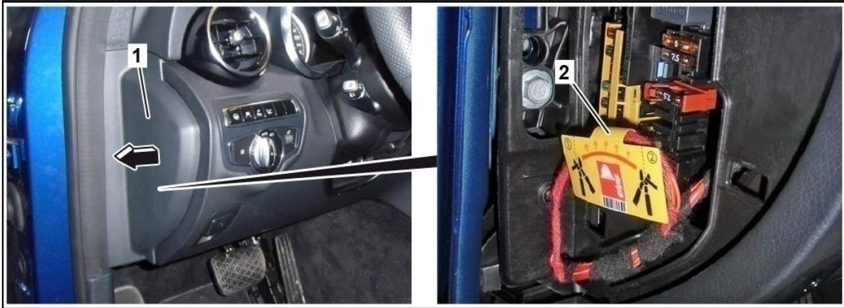
Retirar la cubierta (1) de la caja de fusibles / cortar el cable por el lugar marcado (2)